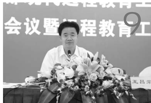
加强领导 狠抓落实 努力推进远程教育