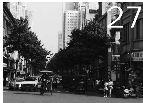
竞争化选拔干部工作的一次成功尝试