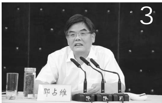
努力开创我市农村基层组织建设新局面