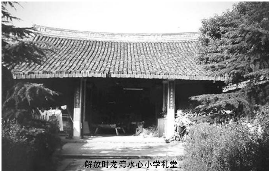
解放时龙湾水心小学礼堂

开庆祝大会，热烈庆祝中华人民共和国成立。我清楚地记得校负责人郑重宣告：国家主席是毛泽东，首都北京，国旗是五星红旗，国歌是义勇军进行曲……我们只觉得浑身火热，有说不完的心里话，新中国诞生了，生活在水深火热中的穷人有救了。