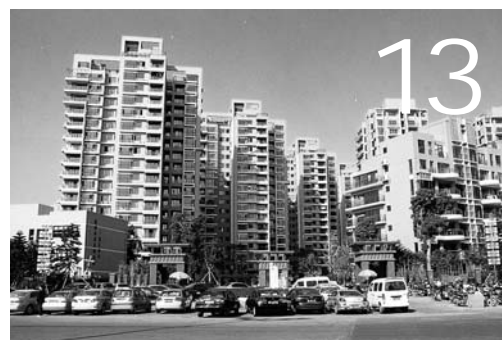
在科学发展的大道上昂扬前行