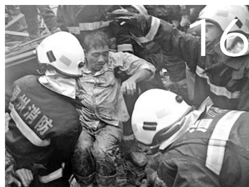
我市广大党员干部奋力抗击台风“莫拉克”