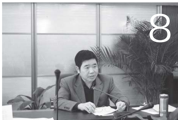
开展好“两个年”活动 推进“活力和谐企业”建设