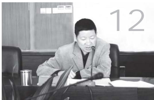
探索综合考核评价办法