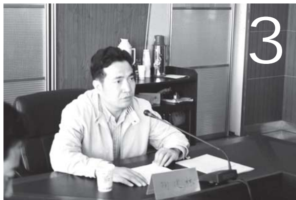
为实现第三次跨越提供坚强的组织保证