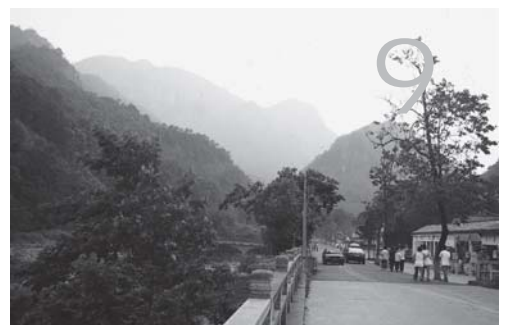
认真学习贯彻党的十七大精神