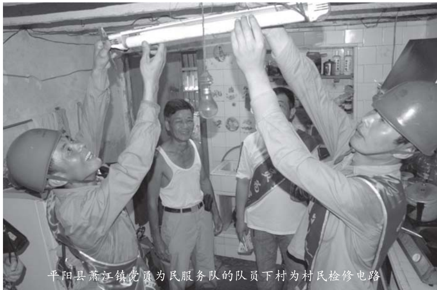
平阳县萧江镇党员为民服务队的队员下村为村民检修电路

对群众公开一句话承诺，是该县在前几年实行的农村党员“设岗定责”基础上推出的一项新制度，要求农村党员向群众作出帮扶承诺和表率承诺。现在，全县广大农村党员正身体力行，积极履行承诺。晓坑乡晓坑村10多名有技术、有能力的党员帮助贫困户选择和落实致富项目，向群众传授新技术；山门镇屿边村的年老党员主动承担调解邻里纠纷、调处家庭矛盾等工作；昆阳镇皇岙村的十几年年轻党员则在“为民服务日”活动上签订了承诺书，主动放弃二胎指标，带来了一股计生新风，为当地群众所效仿。