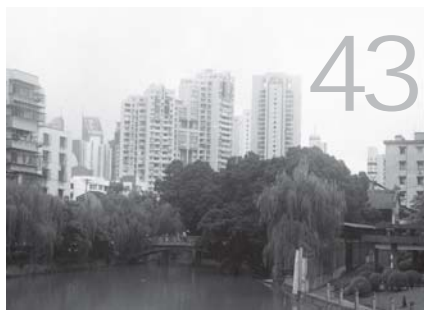
我市党政工作部门领导班子和领导干部综合考核评价试点工作情况