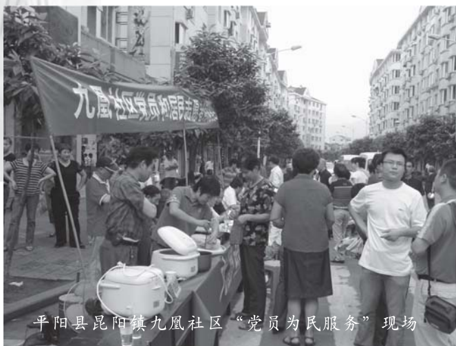
平阳县昆阳镇九凤社区“党员为民服务”现场