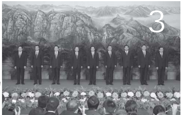
十七届一中全会产生中央领导机构