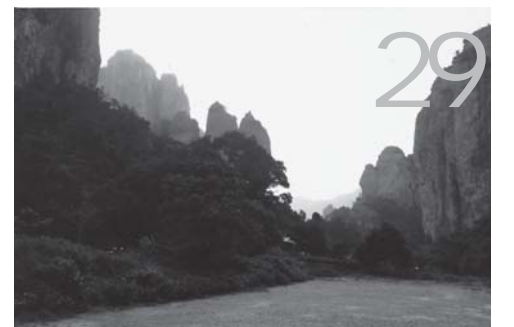
走进矛盾 破解难题