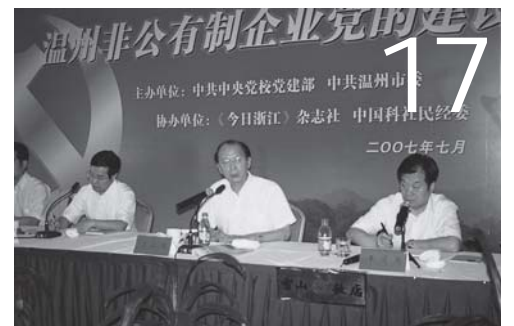
全国党建研究会、中央党校高层论温州非公企业党建工作